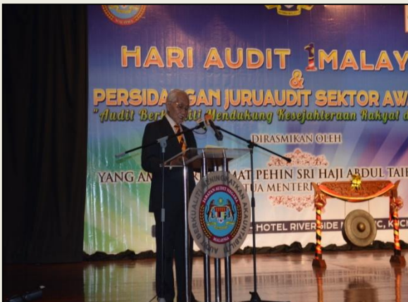
Ucapan Perasmian Oleh YAB Ketua Menteri Sarawak