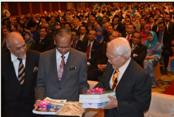
YAB Ketua Menteri Sarawak melihat Standard dan Garis Panduan Yang telah dilancarkan