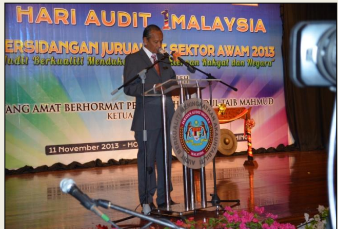
Ucapan Aluan oleh YBhg. Tan Sri Ketua Audit Negara