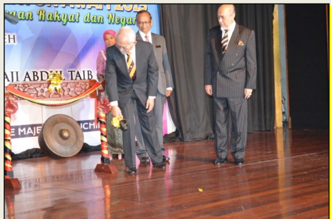
Majlis Perasmian Hari Audit 1Malaysia dan Persidangan Juruaudit Sektor Awam 2013