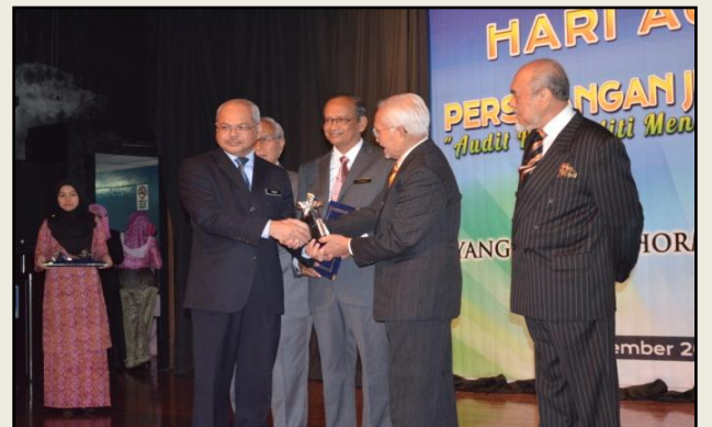
Majlis penganugerahan Anugerah Kecemerlangan Pengurusan Kewangan Berdasarkan Indeks Akauntabiliti