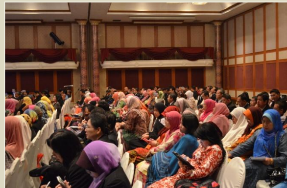
Peserta Persidangan Juruaudit Sektor Awam Tahun 2013