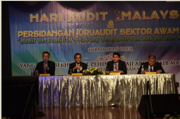
Para barisan panel yang dijemput bagi membincangkan forum: Enhancing Institutional Capacity Through Professional Qualifications