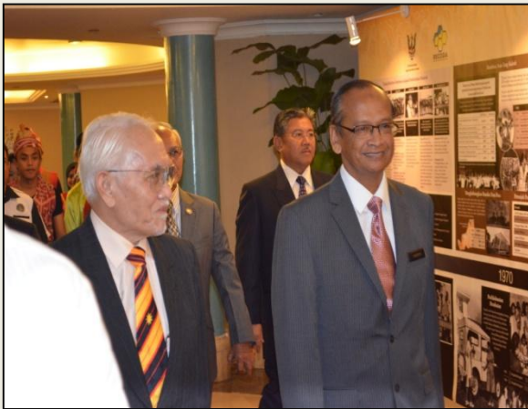
YAB Ketua Menteri Sarawak yang dalam perjalanan untuk merasmikan Hari Audit 1Malaysia dan Persidangan Juruaudit Sektor Awam Tahun 2013